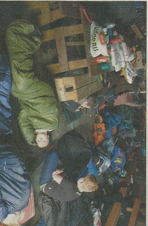
Morgonstund: Snart klart for frukost.