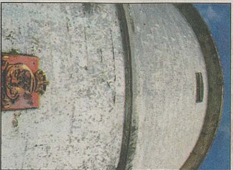
Kongens segl: Kong Carl Johan 14. var kongedå Kvitholmen fyr stod ferdig i 1841.