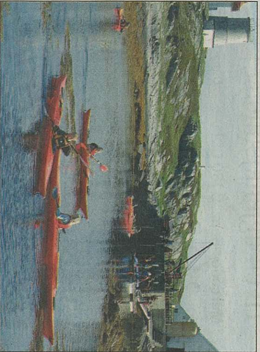
Kvitholmen: Mange prøvde kajakken inne på hamna.