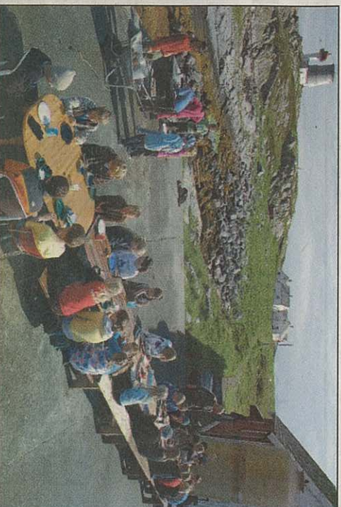
Frukost: Alle de 43 deltakarane åt frukost utedørs på kaia i det fine sommarværet på torsdag.