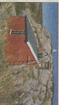
Smia får siste malingsstrøk.