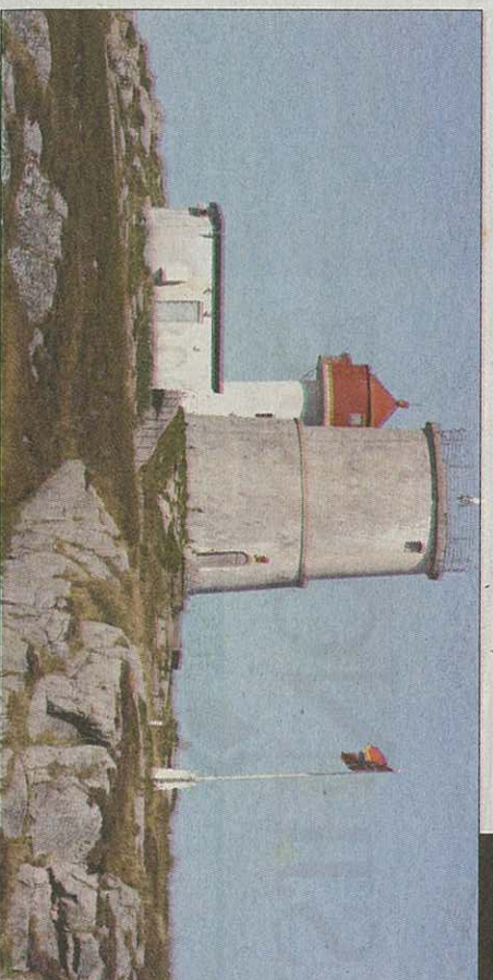
Kvitholmen er etter hvert godt kjent. Stadig flere tar turen ut til øya utenfor Vevang.